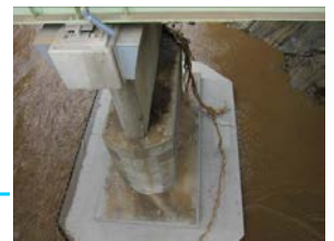
写真-2 豪雨後の橋脚の様子