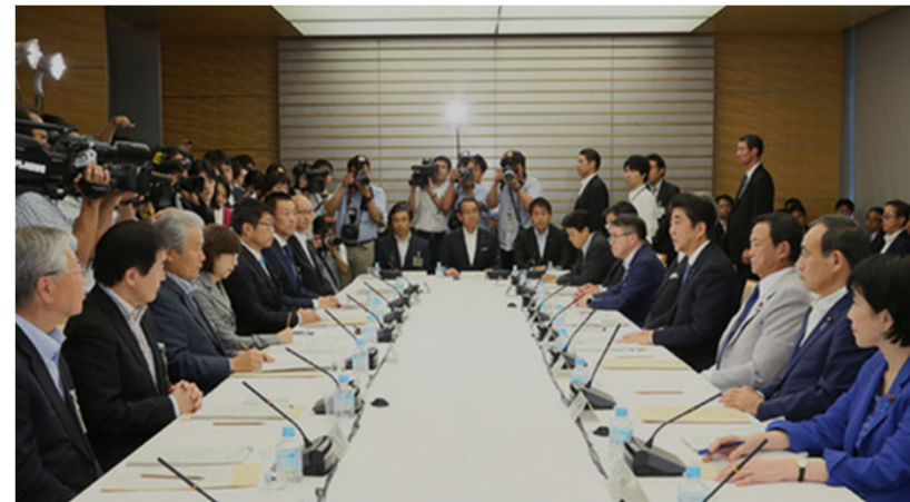
平成28年9月12日未来投資会議の様子