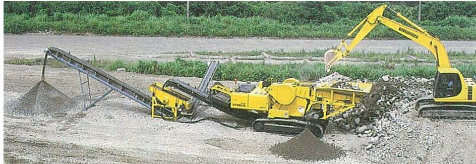
骨材再生の例 【出典：改訂3版土木施工の実際と解説】