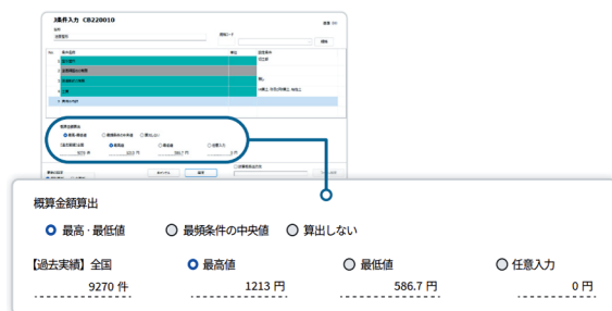
図-2 概算工事費算出機能作業画面(例)

積算サーバと通信が可能なクライアント端末に限定された機能ではあるが、概算工事費算出機能を付与した。現行システムでは、これまで工区分割を検討する際確定していない施工条件を仮入力することで概算工事費を算出していたところ、システム2.0においてはこれまでの工事情報と発注実績を基に、最高・最低値や最頻値から各工種の概算単価を算出することができる。この機能により工区分割の検討作業の効率化が図られる(図-2)。