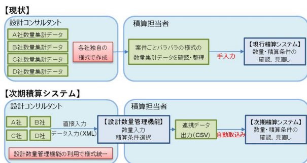
図-3 設計数量管理機能を用いた場合の業務フローの変化

数量や積算に必要な条件が「設計数量管理機能」へ入力された後、積算担当者は「連携データ(csv形式)」を出力し、そのデータを次期積算システムへ取り込ませることで、自動的に数量等の情報の反映ができるようになる(図-3)。