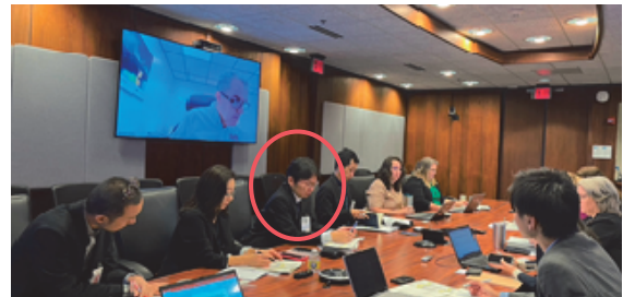
写真-1 フロリダ州交通局調査状況（赤丸筆者）