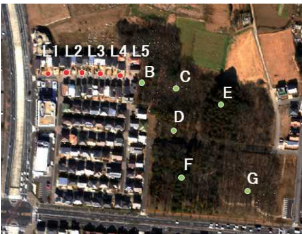
図1 調査対象地と気温観測点の位置

調査対象地(図1)は、茨城県つくば市研究学園の保存緑地及び隣接する住宅地とした。