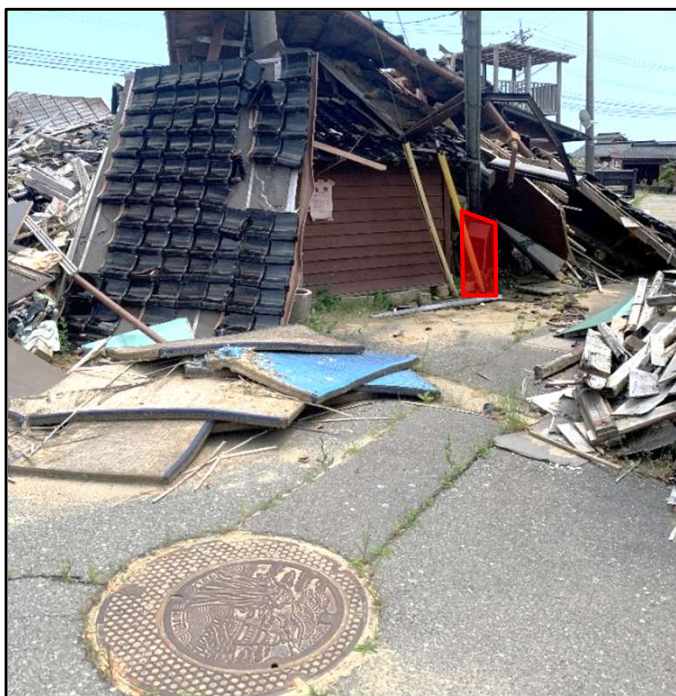
マンホールポンプ操作盤損傷状況 (宝立処理区春日野地区)