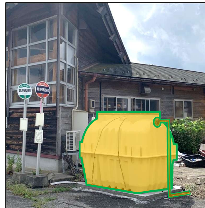
仮設浄化槽の設置 (宝立処理区鶺鴒地区)