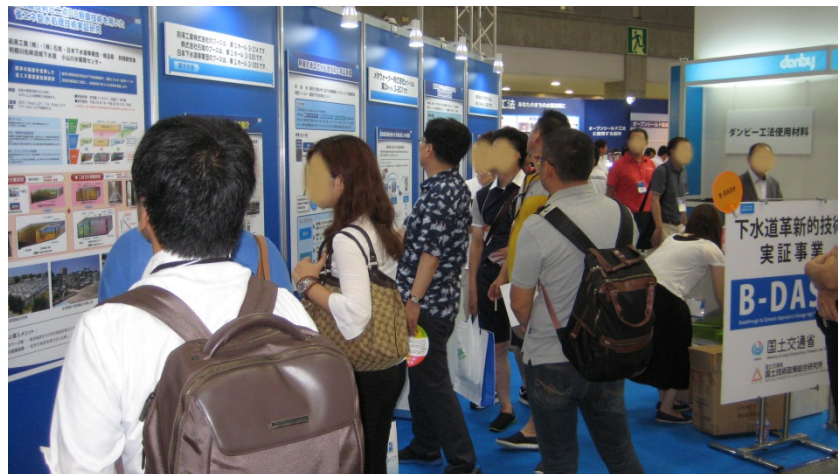
大勢の来場者で賑わうB-DASHブース