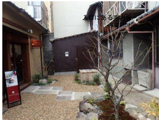
入口にある案内所