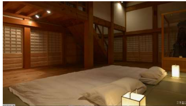
天守における宿泊体験