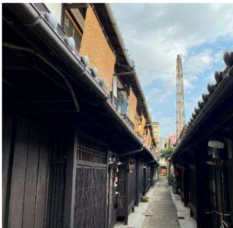
日よけや目隠しとして簾を活用