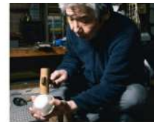
藤匠 竹形堂 Takeshima DESIGN WEEK KYOTO