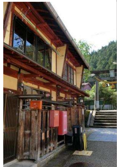
改修したまちやの例（内外装）