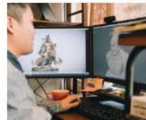
カスタム印刷LIQ GUSTO KYOTO LIQ DESIGN WEEK KYOTO