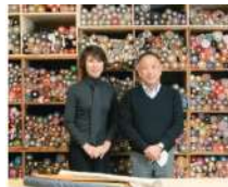
誉勤商店 Kokoro Station DESIGN WEEK KYOTO