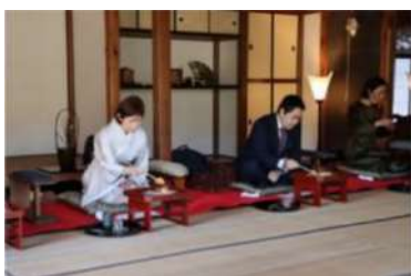
臥龍院に案内して宴席や能などの古典芸能で客人も主人もともに楽しむ