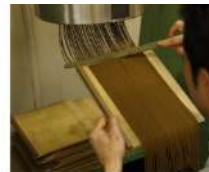
香老舗 松葉堂 Shogakukan Co. DESIGN WEEK KYOTO