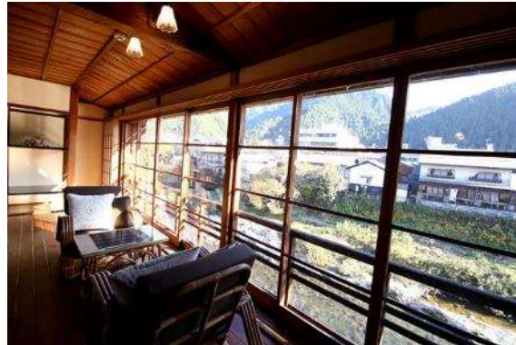
襄河溪房から吉田川を望む