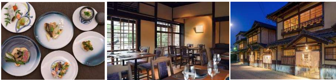
再生町家における飲食体験

大洲城を望む再生町家のレストラン。NIPPONIA HOTELを展開している株式会社バリューマネジメントが運営している。席数は22席。瀬戸内海の海の幸、肘川の川の幸、恵まれた自然地形から生み出される数々の愛媛、大洲ならではの四季折々の食材を売りにしており、ランチ（11:30～15:00）とディナー（17:30～22:00）を提供している。今後、結婚式の受け入れも予定しており、大洲の周辺神社、人前式、宴内和婚人前式の3つの挙式スタイルを選ぶことができ、レストランで披露宴を行う。