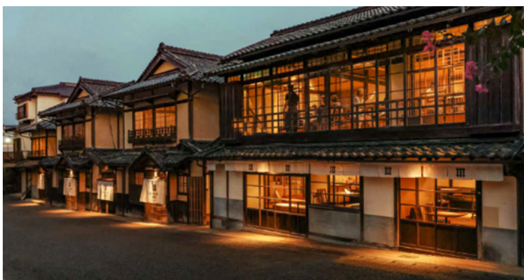
町家を活用した宿泊施設NIPPONIA HOTEL