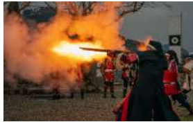
鉄砲隊によるお出迎え