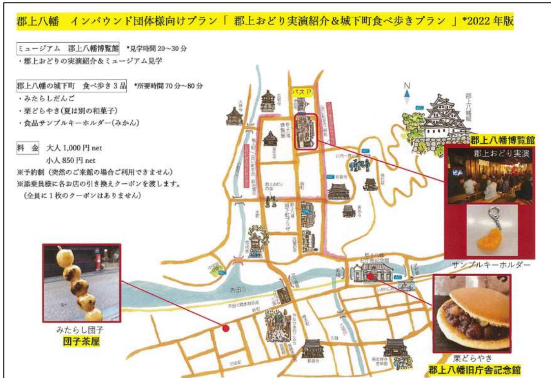
食べ歩きプランで作成したマップ

食べ歩きプランを実施したことで観光客が市街地を散策するようになり、滞在時間、店舗への入込数が増加した。特にインバウンドには、食べ歩きプランを踏破することで記念品がもらえる点が効果的だった。また、郡上踊りを通年で見学できるようにしたことで、夏季集中型から四季型へモデルチェンジする効果があった。