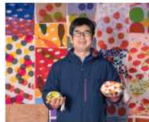
山元堂工場 Yamamoto San Kyo DESIGN WEEK KYOTO