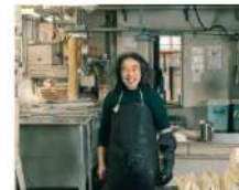
京都川屋商店 Kyoto Kawaya-Shop DESIGN WEEK KYOTO