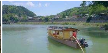
肱川遊びプログラム