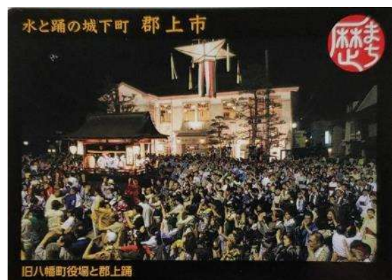
郡上市の歴まちカード

町の回遊を推進するために、重要伝統的建造物群保存地区に隣接して建設された郡上八幡まちなみ交流館等での配布も検討している。