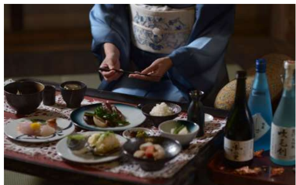
天守における飲食体験