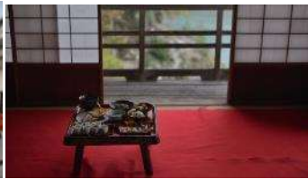
臥龍山荘での朝食