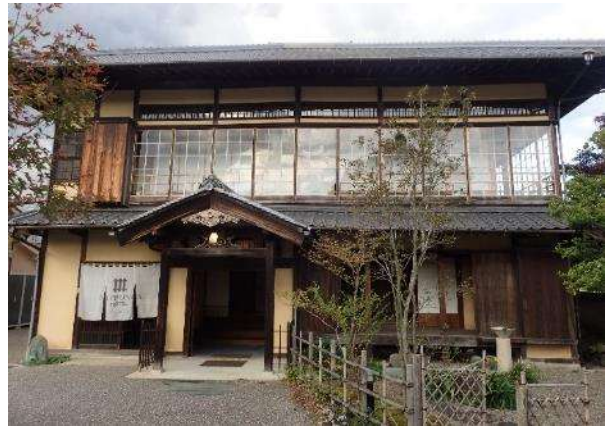
旧加藤家住宅の外観

旧大洲藩主の末裔である加藤泰通が、大正14（1925）年に建築した住宅で、大洲を代表する近代和風建築の一つであり、トイレ、風呂などは改築を行っている。