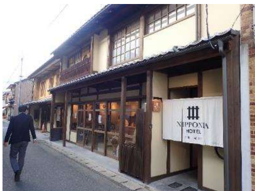
古民家再生ショップ 2階は宿泊施設

古民家や町家を改装して、テナントとして事業者へ貸し出す事業は今後も継続していくとしている。