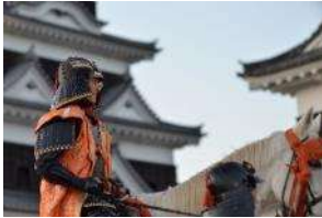
1617 加藤貞泰の入城体験

カスタマイズプログラムとしては、肱川遊びプログラム、文化遺産めぐりプログラム、大洲まちめぐりプログラムなどがある。