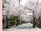
西向日住宅のまちなみ

新しい鉄道の敷設に伴い昭和初期に造成され、桜並木が見事な西向日住宅地は、開発時から自治会誌の発行や街路樹の保全など、住民自らの手で良好な居住環境を大切に守る活動が絶えることなく受け継がれ、当初の区画を今も残し、四季を感じる美しい住宅地景観を形成しています。