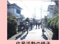
住民活動の様子 (まちなみウォーク)