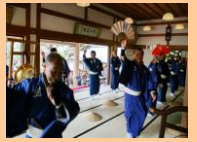
鶏冠井題目踊の様子