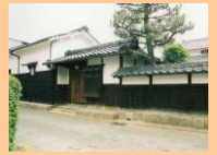
西国街道 中小路家住宅

向日市域を北東から南西へ縦断する西国街道は、古くから人や物資の往来が活発でありました。歴史的建造物や石造物も多く存在し、昔ながらの風情が残る西国街道沿いでは、現在も鶏冠井題目踊や花まつりが営まれ、往時の雰囲気を醸し出しています。