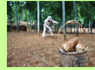
タケノコ畑の様子