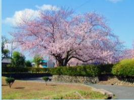
史跡長岡宮跡 大極殿公園

史跡公有化に伴う長岡京大極殿跡などの一体的な保存整備と活用促進を目的として、目に見えない史跡をより体験できるように遺跡表示を整備し、大極殿祭を行う顕彰の場として保全し、維持向上させる整備を行うため、計画を策定し、整備を行う。整備に際しては、文化庁など関係機関と十分に協議し、調整を図り、地下遺構や史跡景観を損なわないよう実施する。