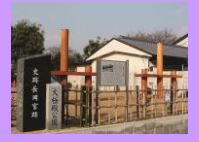
史跡長岡宮跡大極殿公園

784年から10年間の都、長岡京の政治の中心であった史跡長岡宮跡の大極殿公園では、遺跡を顕彰する大極殿祭が地域住民によって明治時代から今日に至るまで続いています。昭和29年(1954)に始まる発掘調査も累計2,200回を超えて途切れなく行われており、日常の暮らしの中に古代を感じることができます。