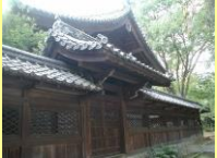
重要文化財向日神社本殿

本市の市名の起源でもあり、奈良時代創建の由緒と歴史を誇る向日神社では、現在でも神幸祭、還幸祭など各種祭礼が氏子組織により脈々と受け継がれています。また境内を取りまく鎮守の森は市街地の中にある貴重な自然であり、歴史ある建造物や人々の営みを見守りつつ、清々しい景観を形成し続けています。