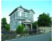
守永家 (旧飯田医院)

歴史的な建造物である旧飯田医院と主屋について、公開活用を図るため、屋根、外壁、内装等の全面改修を行い、観光案内や休憩、地場製品の販売、軽食の提供を行います。