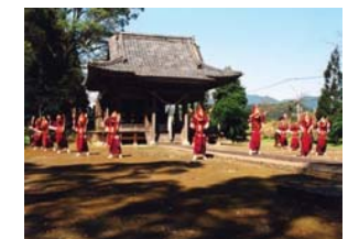
泰平踊(五百禰神社)

泰平踊は、江戸時代前期から鉄肥城下町に伝わる盆踊りの伝承である。登録有形文化財である五百禰神社の庭園においても泰平踊が踊られ、現在まで伝えられている。鉄肥のイメージを代表する優雅な踊りが由緒ある建造物と一体となって、格調高い雰囲気醸し出している。