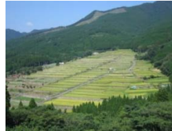
鉄肥杉林と坂元棚田

坂元棚田は、中山間地の不利な条件を克服し、遠距離から水路をひいてくことで水田耕作を継続してきた。そして、住民の手によって守られてきた棚田の周囲には、鉄肥杉林が広がり、農業と林業を両立してきた住民の努力が、現在の美しい景観を生み出している。