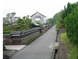
横馬場の石垣や生垣

鉄肥石による石垣や石塀が数多く残されている鉄肥地区は、往時の歴史的景観を維持している。また、石垣の所有者や住民が常に石垣を管理し、美しく保つことで、鉄肥の町並み景観を向上させている。その美しく保たれた鉄肥石で囲われた屋敷地と鉄肥杉の住宅が城下町の佇まいを今に伝えている。