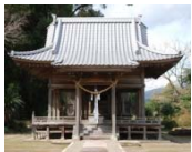
五百禊神社 (令和2年実施済み)

周辺の庭園等の環境について、一体的な改修整備を行い、伊東家墓所や西南戦争戦没者墓地等とともに観光資源として活用します。