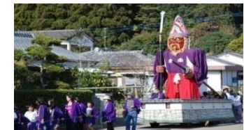
御神幸行列(別体弥五郎様)

田ノ上八幡神社で行われる弥五郎人形行事は、神社の祭祀として南九州に伝えられてきた。形態を変化させながらも大切に継承されている弥五郎人形や御神幸行列は、住民の世代間の交流や歴史への興味を抱かせる役割を担っている。