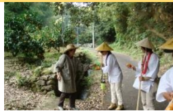
お廻路さんとお接待の様子⇒

佐野の町は、阿波と伊予、讃岐の接点に位置し交通の要衝地であったと共に四国霊場六十六番札所「雲辺寺」への廻路道もあったことで、宿場町や商家町としても栄えていった歴史がある。現在では、国道の開通等によって当時のような賑わいは見ることはできないが、馬路川と平行する旧街道と町並みには、秋には佐野神社の例祭による太鼓台が運行する光景が見られ、また日々雲辺寺へ向かうお廻路さんの姿や地元住民によるお接待の様子が見られる。