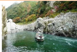
大歩危小歩危峽と船下り⇒

明治24年から25年の工事にて開通した「四国新道」（現国道32号線）の開通により、道路から見える「大歩危小歩危」の景色は景勝地と呼ぶにふさわしく、大歩危小歩危峽を舟下りで観賞するようになってからは、観光地として広く認知されていった。また危険な場所を意味する大歩危小歩危には、住民や通行人の安全を祈願する岩本神社や地藏菩薩が建立され信仰されている。