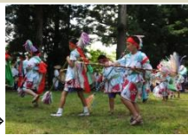
民俗芸能を体験する地元小学生⇒

近年の人口減少及び少子高齢化、若者の都市流失に伴う民俗芸能の後継者不足は深刻であり、古来の伝統的な形態が失われつつあるため、担い手育成のため地域内外の学校・地域との歴史文化教育を推進し、「見る・聞く・触れる」の体験型プログラムを実施する。