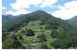
祖谷に見られる山村集落⇒

祖谷地方には、伝統的な古民家や平家伝説に関連する伝統的建造物と、周辺の急峻地形に形成されるのどかな段畑風景、そして、厳しい自然環境のもとで伝統生業や生活慣習を大切に継承する人々の姿がある。この地に古くから伝承されてきた平家伝説は、こうした固有の風土によって育まれ、脈々と今日まで受け継がれてきたものである。素朴な山村集落の原風景と平家伝説が一体となった風情には、地域固有の歴史と伝統が醸し出されている。