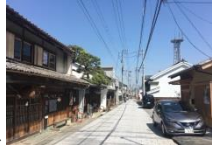
景観を阻害する電線等⇒

歴史的風致を形成するものとして、祖谷、大歩危小歩危に見られる「山村集落」と池田町や井川町に見られる「うだつの町並み」が見られる。しかしながら、過去の高度経済成長や観光地化したことにより、景観にそぐわない建造物や工作物が建てられてきた。伝統的な町並み形成の再生を図るため、景観を阻害する工作物の「見えない化」などの整備を行う。