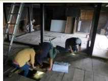
山村集落にある歴史的建造物を調査⇒

長期間の空き家に伴い老朽化が進み解体が行われている。こうした建造物の中には歴史的な価値が高いものも少なくない。今後も、歴史的価値の高い文化遺産が掘り起こされず失われていくことがないよう、各地域ごとに自治会等と連携し建造物のみならず総合調査を実施する。