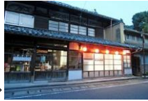
地域住民による空き家活用⇒

近年の少子高齢化や過疎化他市街地においても、若者の都市流出が進んだことにより空き家は増加し続け、歴史的建造物の維持保存が難しい状況となっている。こうした状況を踏まえ空き家となった商家を取得又は借り上げのうえ修理修景を行い、地域の歴史的風致の核となる施設として整備する。