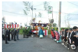
吉田神社の祭礼の様子(船渡神事)

旧城下町やその周辺では、水戸城や水戸藩ゆかりの祭りが今も残されている。また、郊外の伝統ある祭りも、水戸藩や旧城下町とゆかりのあるものが多い。これら祭りは、八幡宮や薬王院といった歴史的建造物とあいまって、本市の貴重な歴史的風致となっている。