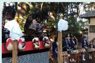
大串のささらばやし▶

無形民俗文化財等の伝承保存及び後継者育成を図るため、活動団体に対して補助金を交付して、その活動を支援する。