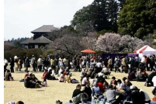
現在の梅まつりの様子

明治以降に観梅の催しが始まり、梅まつりとして本市を代表する伝統行事となった。また、隣接する千波湖は借楽園の借景となり、周辺の緑地とあわせて、今も人々に親しまれている。