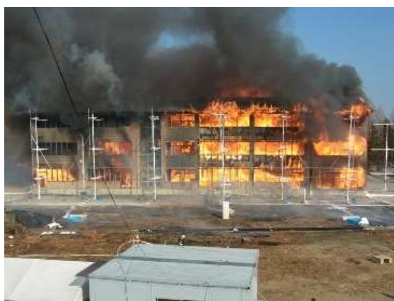
写真 1.1-1 実大火災実験(予備実験)