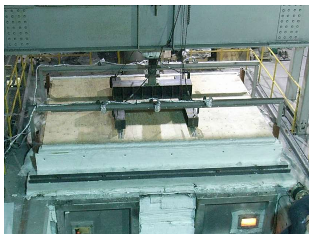
写真 1.2-2 部材実験(床)