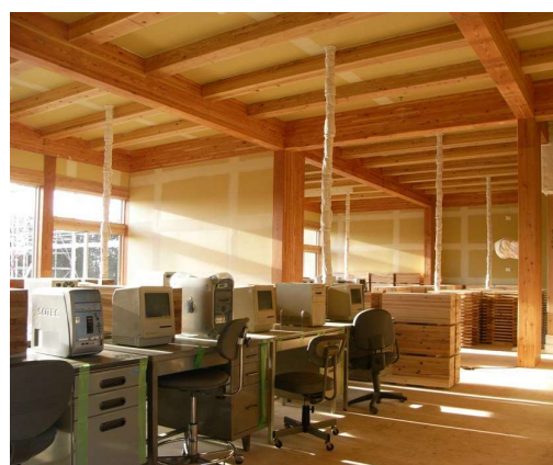
写真 1.1-4 職員室 (準備実験)