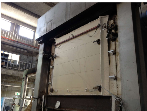
写真 1.2-1 部材実験(壁)