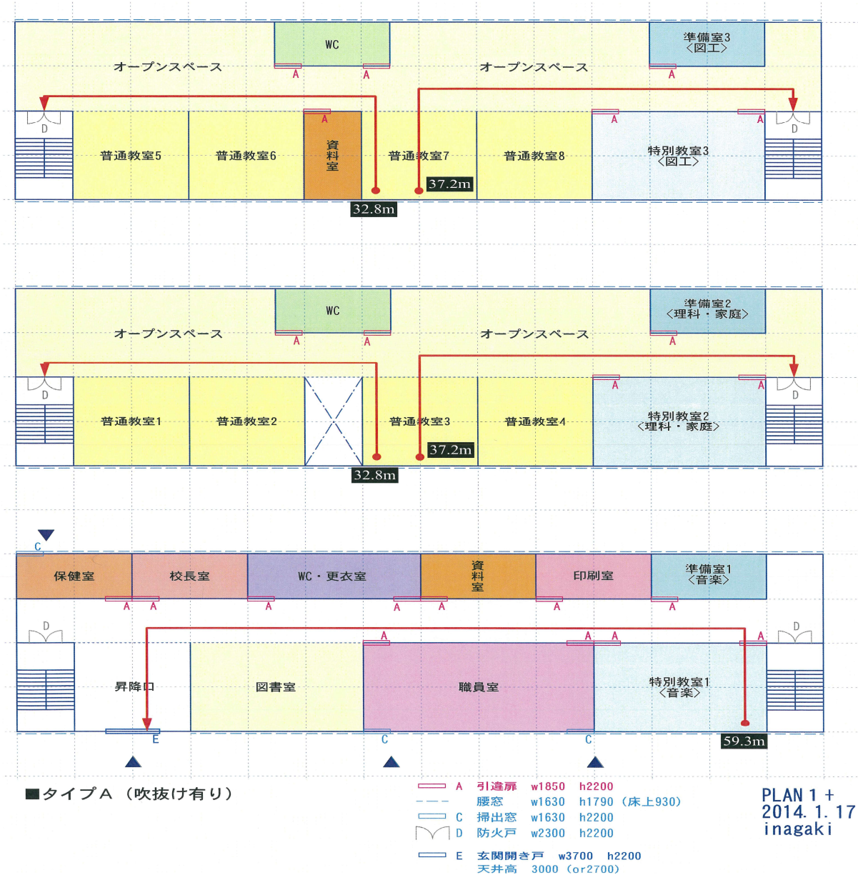
図 1.6-1 避難計算に用いたモデルプラン