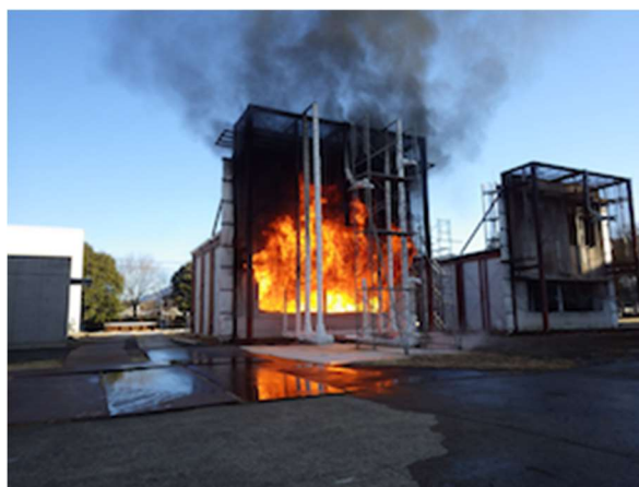
写真 1.4-2 屋外区画実験の様子