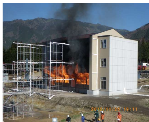
写真 1.1-2 実大火災実験(準備実験)