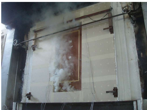
写真 1.2-3 部材実験(特定防火設備)