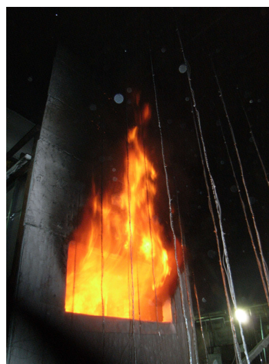
写真 1.5-2 噴出火炎実験の様子