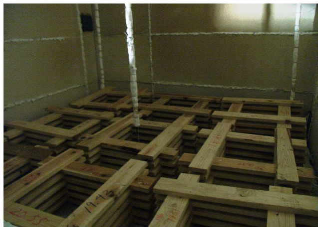
写真 1.5-1 収納可燃物の設置状況