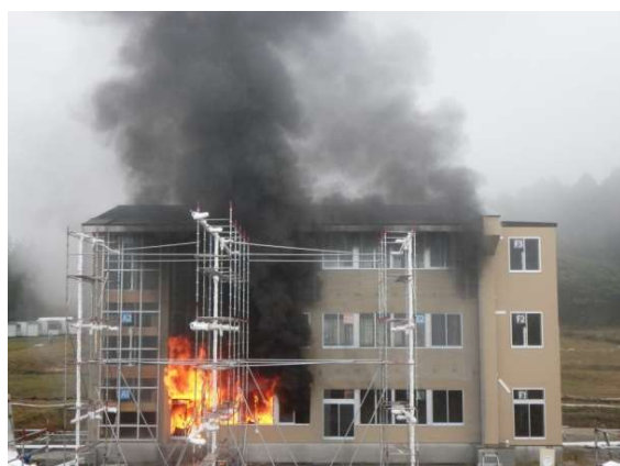
写真 1.1-3 実大火災実験(本実験)