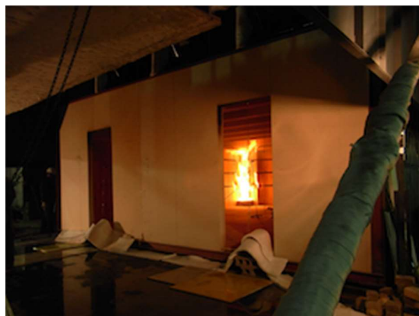
写真 1.3-2 教室実験の様子