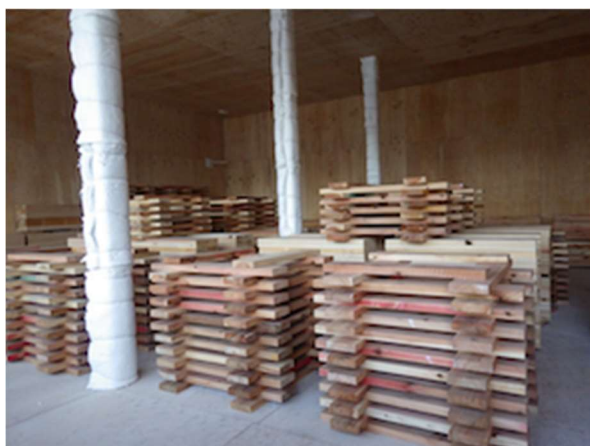
写真 1.4-1 収納可燃物の設置状況