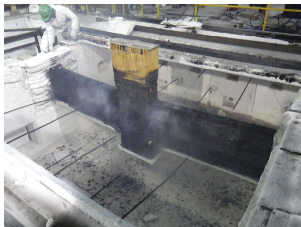
写真 1.2-4 部材実験(柱・梁接合部)