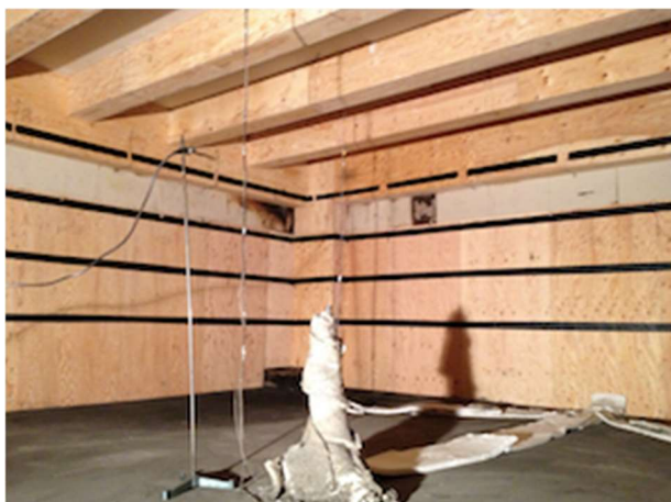
写真 1.3-1 教室実験装置(木質内装)