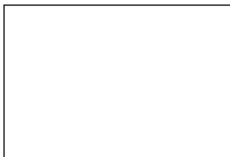
コバテイシの倒木