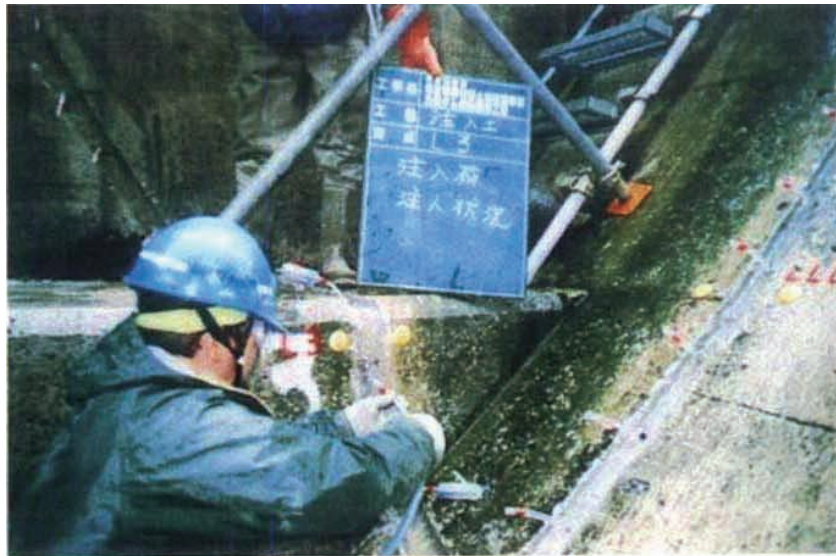
施工状況 注入工注入状況(L3+0m)。