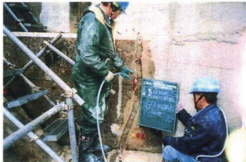
施工状況 注水工先行水押し。