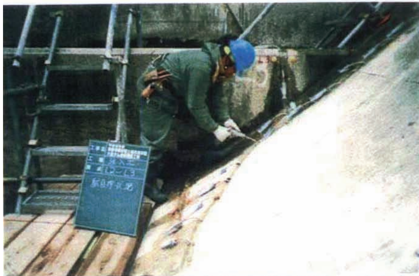
施工状況 注入工後押し(だめ押し)注入(L2+0m~L3+0m)。