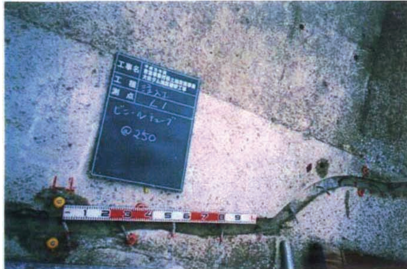
施工状況 ビニールチューブ施工。