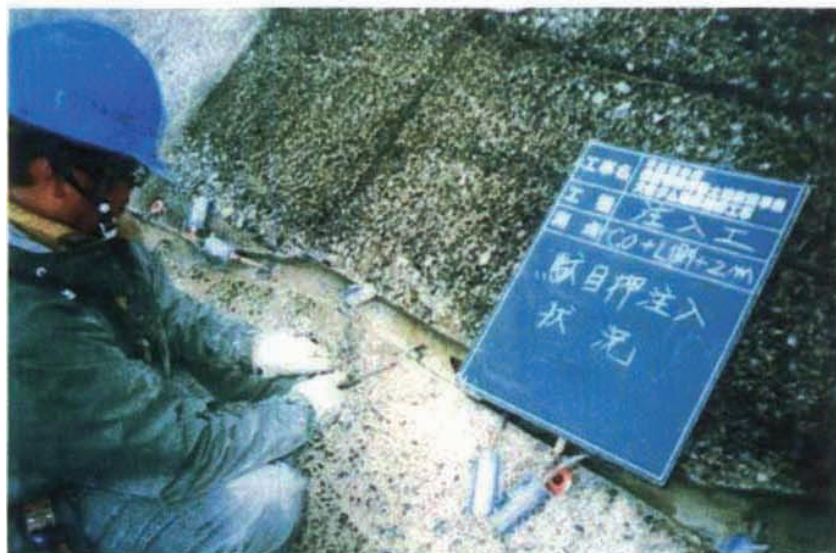
施工状況 注入工後押し(だめ押し)注入(CL0+2m)。