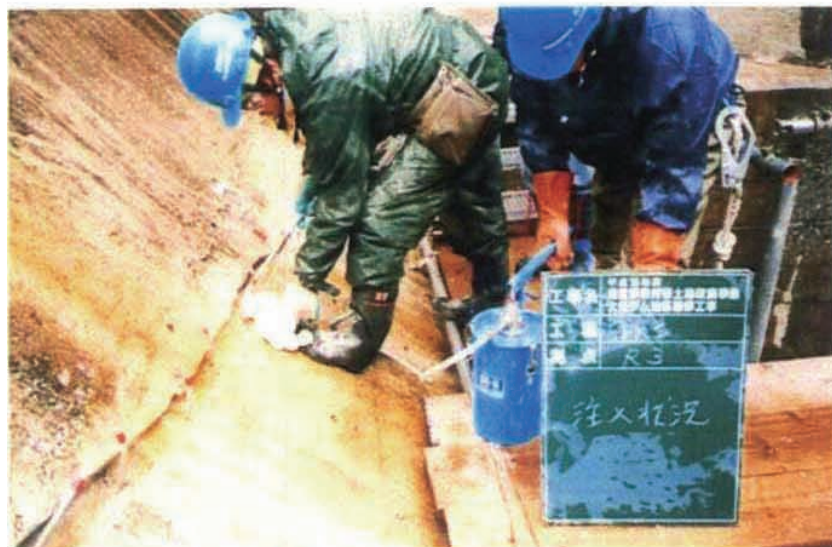
施工状況 注水工注入状況。