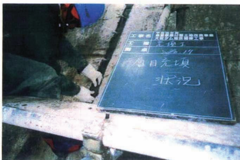
施工状況 充填工1層目。