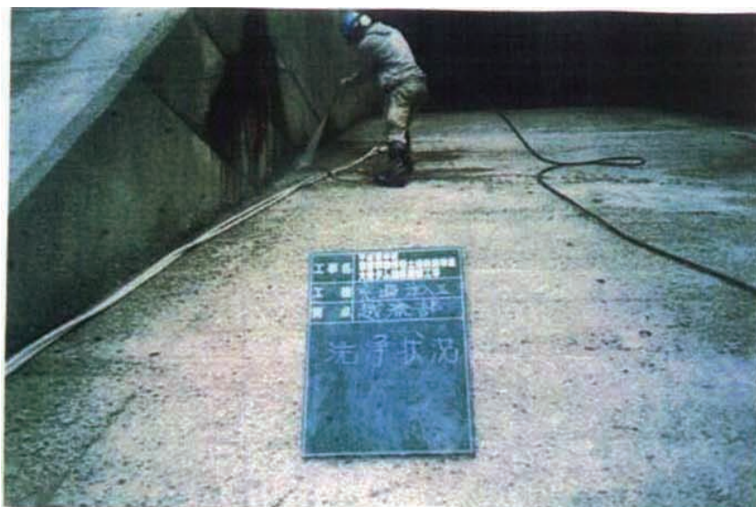
施工状況 充填工洗浄工。