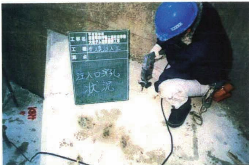
施工状況 充填工注入孔削孔。