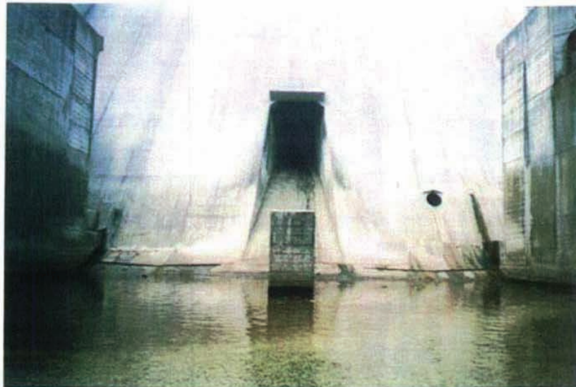
施工状況 着工前 堤体下流面正面。クラックは堤趾部水際。