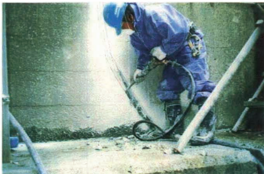
施工状況 充填工ハツリ施工。