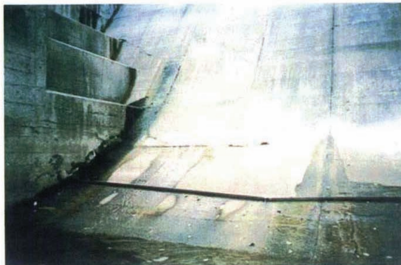
施工状況 着工前 堤体下流面右岸側。下端部のクラックから しみ出し状の湧水が見える。