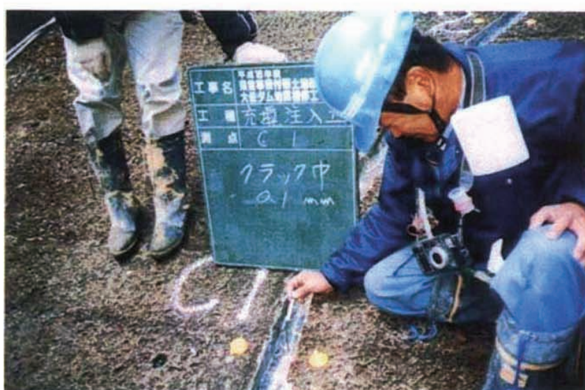
施工状況 クラック計測。