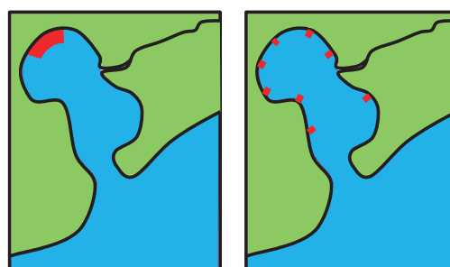
図-2 生息場の空間配置の選択パターン

多様な生物に対して、新規加入や多世代に亘る持続可能性を研究し、さらに環境インパクト後の復元性の確認を研究している。今後、計算を1次元から2次元、3次元へと拡張し研究していく予定である。また、魚など能動的生物にも拡大し、実際の護岸や底泥の性状、生物の生息基盤状況等の調査・分析も行い、デザイン手法をまとめる予定である。