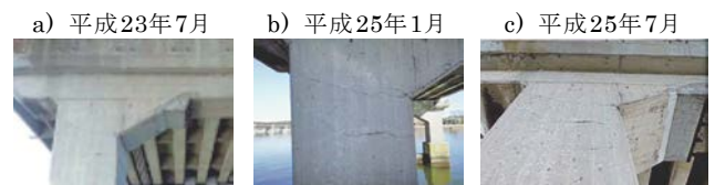
写真-3 橋脚柱頭部のひびわれの進展