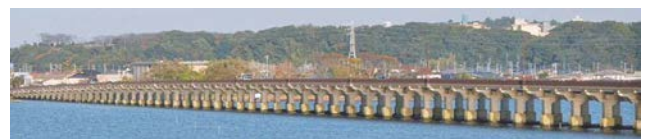
写真-1 神宮橋の全景

本橋の地点では震度5強の揺れが生じました。本橋では、地震発生直後に橋上からの目視点検、同年4月には遠望目視による緊急点検を実施しましたが、これらの点検では交通に支障を来す損傷は確認されませんでした。しかし、同年7月に船により各橋脚の近接目視による緊急点検を行い、柱部や下層梁にひび割れが生じていることが確認されました。その後、2013年1月に第3回目の定期点検を近接目視により行い、柱部及び下層梁に生じていたひび割れの箇所数が増加していることがわかりました。このため、同年7月にさらに臨時点検を行ったところ、橋脚の柱部や下層梁を中心にひび割れが以前よりも進展している箇所があることが確認されました(写真-2, 写真-3, 図-1)。