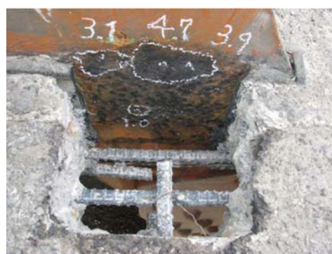
図-2 床版はつり調査