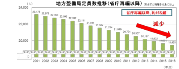
公共工事の発注者側の職員数推移