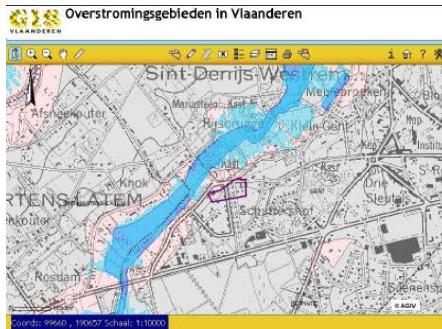
Web上の洪水危険地図の例(フランダース地方)

モデル氾濫地域地図(Modeled flooded area maps: MOG-map)として再現期間2、5、10、15、20、25、30、40、50、75、100、150、200、250、300、500及び1,000年の浸水範囲、浸水深、浸水時間がインターネット上で提供されている(下図には25年確率の洪水による浸水範囲と近年の浸水範囲が示されていると考えられるが、どちらの色が該当するのか、また、濃いピンク色の線が何を意味するのか不明)。