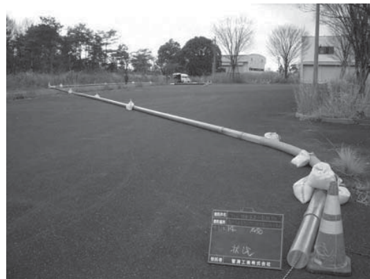
写真-1 走行試験状況

また TVC 機種として、使用実績の多い連結型 TVC 及び一体型 TVC を使用した（図-2 参照）。