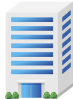
民間企業 (賛助会員)