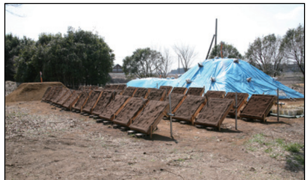
写真-1 表土を保存した盛土(奥)と植生基材吹付工を施した木箱(手前)

植生基材吹付工で表土や在来種の種子を使用するために必要な植生基材の耐候性について、野外で植生基材吹付工を施工して侵食量を測定することで把握することにした。植生基材のみを吹き付けた区画(植生基材区)と、植生基材に表土を混入した区画(表土吹付工区)と、緑化用種子を含む通常の植生基材吹付工の区画(緑化用種子利用区)を設置した。吹付は 3 月に、