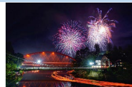
只見川を彩る花火

阿賀野川水系最大の支川である只見川は、本町を縦断するように流れており、古くから舟運などの交通や、川を利用した交流などに利用されており、本町の豊かな歴史文化の母体となっている。また、圓藏寺霊まつりにおいて行われる花火大会では、多くの見物客が集まり、大きな賑わいを見せている。昭和3年（1928）には只見線の運行が開始しており、平成23年（2011）の豪雨災害による断絶が一時あったものの、現在に至るまで風光明媚な路線として多くの人々に愛されている。