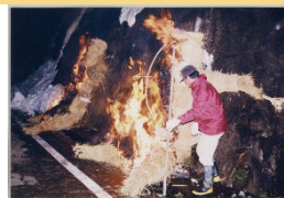
ニンギョウマンギョウ

本町の南部に位置する西山地域では、軽井沢銀山や西山温泉などの豊富な地下資源活用の歴史を有している。軽井沢銀山の銀を運搬した銀山街道は、現在も維持管理されており、西山温泉は秘湯として多くの人々に愛されている。各集落において「ニンギョウマンギョウ」や「センドムシ（タイマツブチ）」といった特徴的な伝統行事や祭礼が脈々と継承されている。