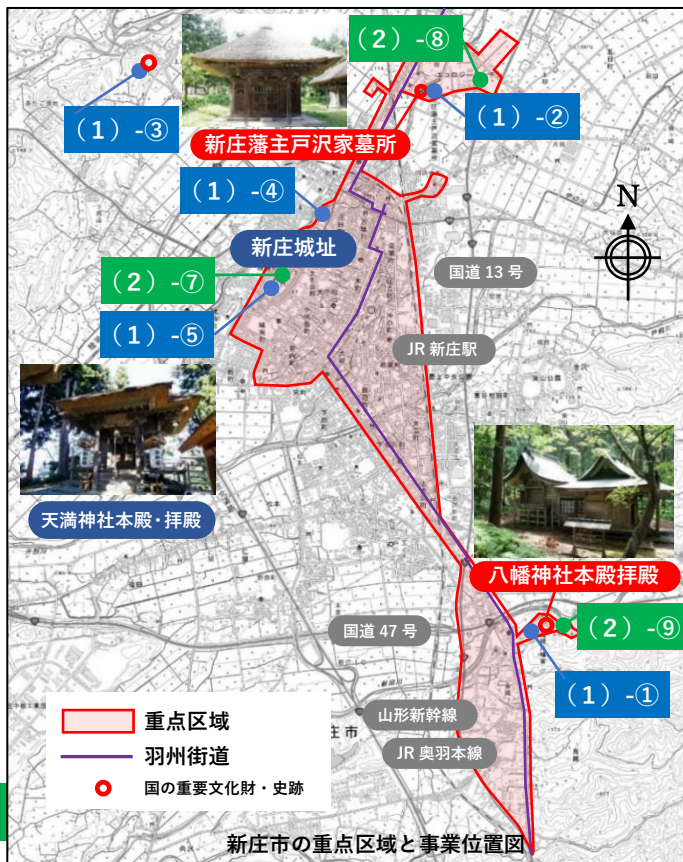
新庄市の重点区域と事業位置図

市街地の歴史的風致を形成する建造物の調査や所有者の意向調査を実施し、歴史的・文化的な価値付けを整理するとともに、保存活用を支援します。