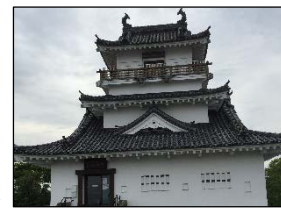
歴史的風致形成建造物の候補 ▶

歴史的風致を形成する建造物を良好な状態で維持するため、歴史的風致形成建造物に指定した建造物の保存修理を実施する。これにより、歴史的な建造物の保存・活用を推進する。