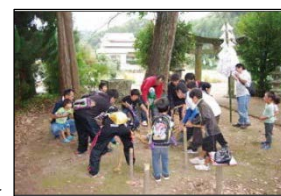
伝統的な亥の子行事 ▶

地域で受け継がれている祭事等（指定文化財又は未指定文化財）について記録調査を行う。この結果をもとに学識経験者等の協力を得て報告書等を作成し、伝統文化の継承を図る。