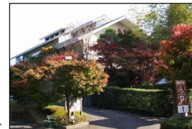
きつき城下町資料館 ▶

杵築の城下町全体のガイダンス拠点である「きつき城下町資料館」において歴史資料を保管する収蔵場所の整備を行う。資料の適正な調査・研究と併せて一般公開を行うことで、来訪者への歴史的風致の周知を図る。