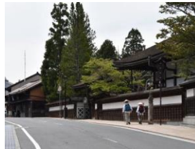
町石道を歩く参詣者

高野参詣の関連遺産に拝礼しながら参詣する姿や道普請等の地域の人々のもてなしは、今も大師信仰によって支えられているものが大きい。遠くから高野山を目指してくる人々の想いと地域の人々のもてなしの心が、歴史的遺産の風景と重なり合い、高野町独特の歴史的風致を形づくり、これからも継承されていく。