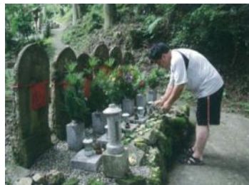
高野槇を供える姿

高野槇は、その名からも想像されるように、高野山と非常に関係の深い植物である。高野山では、古来より高野槇は霊木として保護育成されてきた。高野山を中心とした地域では、多くの歴史的建造物や石造物に高野槇が供花され、集落の周辺には整った槇畑が広がり、町中では参詣土産に高野槇を求める参詣者と販売する住民の姿がみられる。このような真言密教の根本道場である高野山と高野槇の関係により形成された独特の景観は、後世に伝えていくべき歴史的風致である。