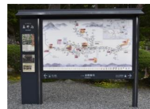
観光案内板イメージ

文化財等の歴史資産や歴史的なまちなみ等について、多言語解説及び二次元コード付の案内板や標識を整備することにより、外国人観光客等へ効果的な情報発信を図る。