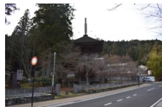
金輪塔と金輪公園

重点区域内に点在する寺院や堂塔等の歴史的建造物について、保存活用を図るため、歴史的風致形成建造物に指定し、修繕や耐震・防災対策等を行う。金輪公園の整備に合わせ、公園内にある金輪塔の整備を図る。