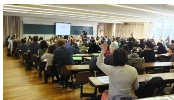
高野山学基本講座の様子

弘法大師空海が開創して以来、歴史と文化によって育まれた「高野山」を歴史、思想、芸術、信仰、自然、政治、建築等の様々な視点から体系的に学び、再発見する機会を提供する。