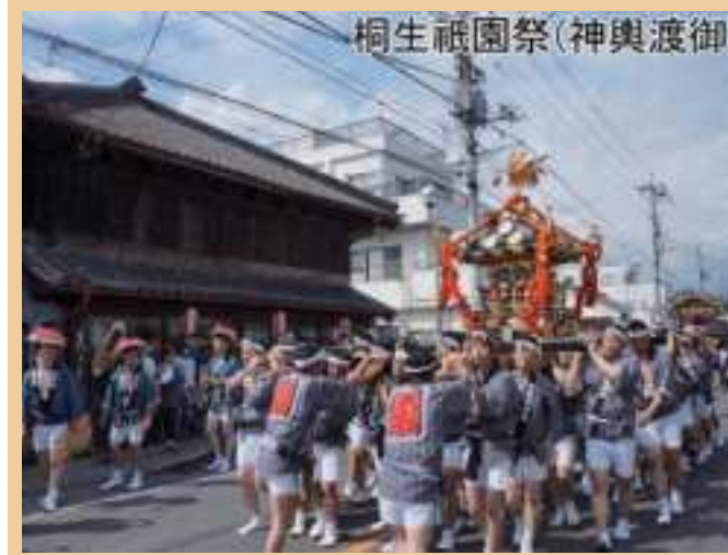
桐生祇園祭(神輿渡御)