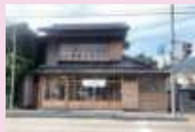
修理後の伝統的建造物

○桐生新町伝建地区の特定物件の保存修理を実施する事業者に対し、修理に掛かる経費に対し補助金を交付し、歴史的な景観の保全・形成を図ります。