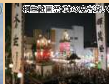
桐生祇園祭(鈴の曳き違い)