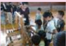
実際の織機で織物体験

○桐生織伝統工芸士が学校へ向け、織物の仕組みや伝統工芸品の特性などの講話を行います。児童が織機を使って織物製品を製作します。