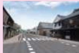
本町通り整備イメージ

○桐生新町伝建地区内の本町通りを、歴史的な町並みとの調和を図るために、電線類地中化と歩道整備を行い、舗装等の美化を実施します。