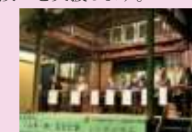
屋台でのシンポジウム

○歴史まちづくりに関連するシンポジウムやバスツアー等を開催します。 ○歴史的風致維持向上支援法人の設立を視野に、歴史まちづくりに関連する事業を遂行できる団体等の設立を支援します。