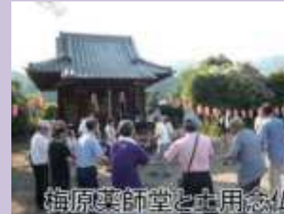
梅原薬師堂と土用念仏