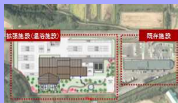
道の駅拡張イメージ

歴史に関心を持つ町民や来訪者が交流することができる場であり、慧日寺門前町としての歴史に関する適切な情報を発信できる施設として、道の駅の機能を強化する。