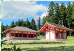
■ 国史跡慧日寺跡 金堂・中門