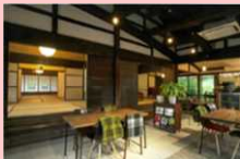
門前市整備イメージ

慧日寺参道沿いの町有物件を活用し、歴史的景観を象徴するファサードをもつ観光案内所を兼ね備えた施設を整備する。