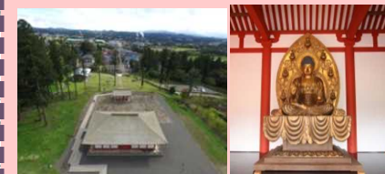
史跡慧日寺跡全景

史跡慧日寺跡の建物遺構の伽藍復元整備を継続的に実施するとともに、植栽修景、周遊路の整備などを行う。 また、金堂内に展示物を制作し、説明パネルや、模刻作成工程の解説公開に向けた撮影記録、史跡散策者へ音声ガイドシステムを構築し、見学者の史跡理解を助けると共に、文化財の保全意識の高揚を図る。