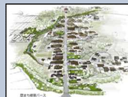
まちなみ整備イメージ

歴史的まちなみを再生し、まちなみの連続性を創出するために、歴史的風致形成建造物及び歴史的な建物や塀、石垣などの修景、改修等に対して支援を行う。