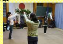
巫女舞の練習風景

磐梯町に残る祭礼等の活動の把握と記録作成、用具の修繕、財政支援、活動支援を行い、継承保存を図る。