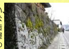
本寺地区に残る石垣

町内に点在する歴史的文化遗产の総合的な実態を把握するための調査や歴史的建造物等の所在や建築年代、建築技法等の悉皆調査を行い、歴史的なまちなみや歴史的建造物の内外の把握と利活用を進める。