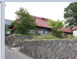
慧日寺参道沿いの民家