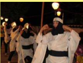
津和野踊(盆おどり)

殿町通りをはじめとした旧城下町では、仏教行事として4月の花まつり、盆の津和野踊(県指定無形民俗文化財)が、宗派を超えて行われます。