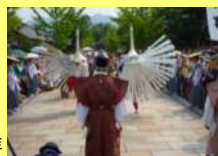
津和野弥栄神社の鶯舞