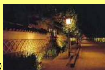
夜の殿町(イメージ)