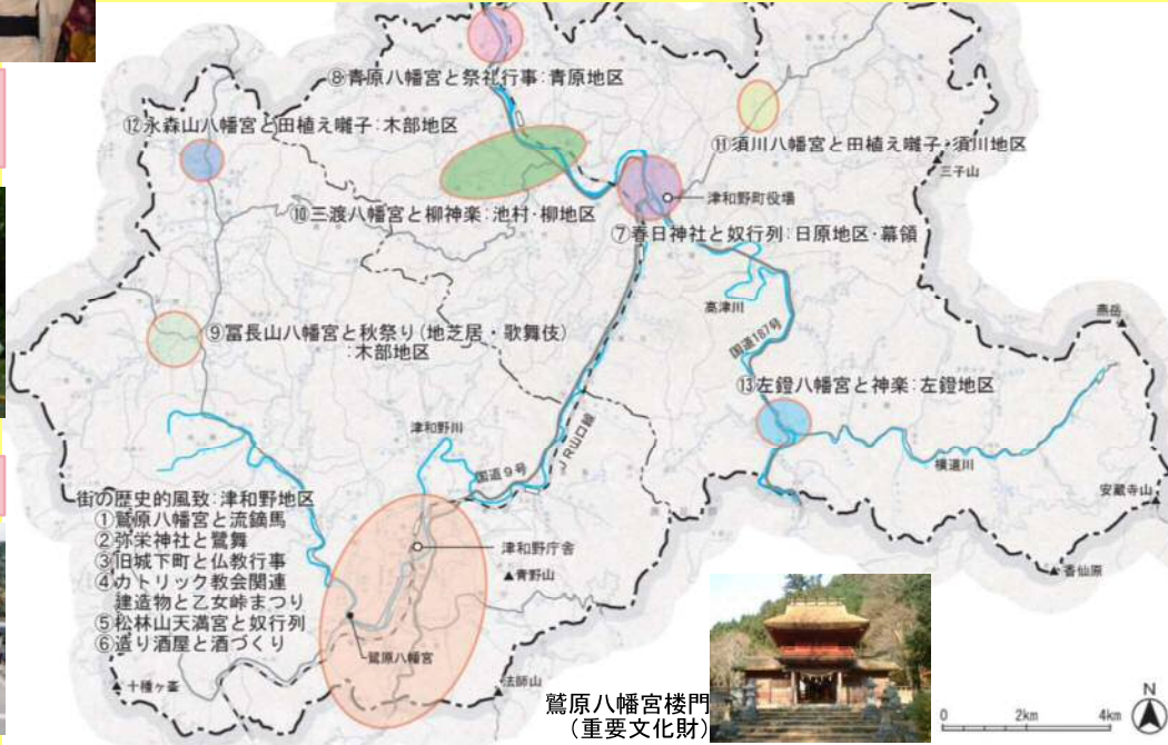
鷲原八幡宮楼門(重要文化財)