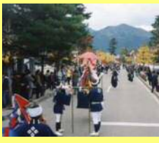
殿町通りと奴行列

奴行列は、毎年11月23日に近い日曜日に、殿町や本町通りなど旧城下町で行われます。参勤交代を模したものです。