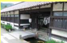
津和野藩校養老館