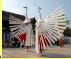
津和野弥栄神社の鷲舞

重要無形民俗文化財の津和野弥栄神社の鷲舞は、毎年7月20日と27日に弥栄神社や歴史的建造物が数多く残る旧城下町で行われます。