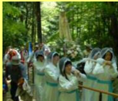
乙女峠の坂を上る信者たち

乙女峠まつりは、毎年5月3日に開催され、津和野カトリック教会(登録有形文化財)をスタートし乙女峠まで行進し、ミサが行われます。