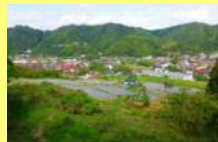
国道9号から見る棚田と街の風景