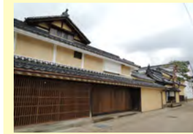
寺町商家 (旧金箱邸)

北国街道松代道周辺の文化財や歴史的建造物等を、ゆつたりと周遊できる道を整備する。