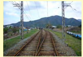
文化財等周遊道路整備