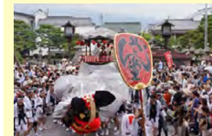
弥栄神社の御祭礼

神楽・屋台を保存するとともに、透かし彫りの龍や唐獅子、牡丹など優れた技術の情報発信を行う。