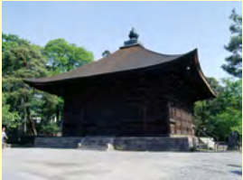
善光寺経蔵

善光寺経蔵の耐震性能並びに耐震上の課題を把握した上で、全面的な構造補強及び保存修理を行う。