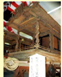
鬼無里神社の屋台