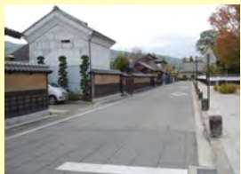
松代地域道路美装化路線