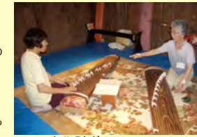
文化財ボランティア