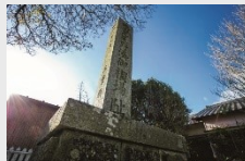
さいおうのおのみなとおんみそぎばあと 齋王尾野湊御祓場跡