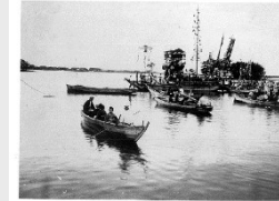
海上渡御(大淀祇園祭)

町内には民俗行事として、大淀祇園祭や宇爾 うに 桜神社天王踊り等が受け継がれています。こうした行事は、地域の人の手で古くから受け継がれてきており、農村と漁村を舞台として、町民の情熱と地域が一体となった伝統的な祭りの風情を感じさせています。