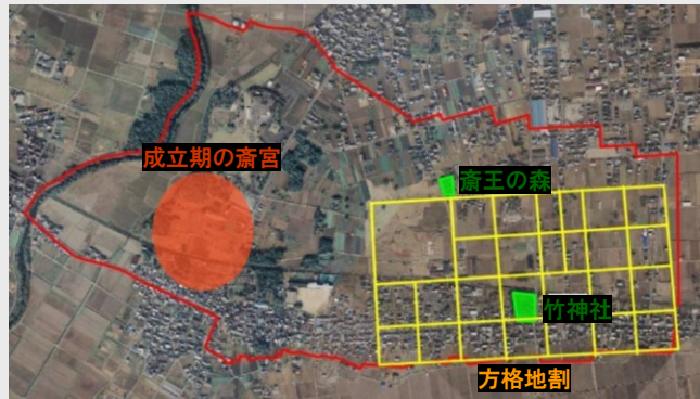
齋宮成立期と方格地割の位置図

齋王制度が廃絶した後、齋宮の旧跡地である「齋王の森」や「野々宮(竹神社)」は、神聖な場所として現在も地元住民に守られ、明治以降の齋宮復興への運動により、史跡指定に繋がりました。地元住民等は往時の隆盛を誇った齋宮の様子を目にすることはできない中で、その姿を皆が思い描きながら、「齋王の森」や「野々宮」を守り続け、ありし日の「齋宮」を思い起こして、市街地に眠る歴史を大切に伝え残すという思いを受け継いでいます。