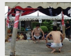
中村の安産祈禱相撲