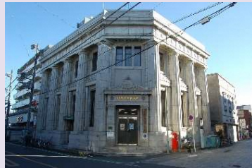
川越商工会議所 (登録有形文化財)

米穀や織物を中心に発展した商業は、県内初の銀行創設に始まり、現代に至る様々な産業と、蔵造りの町並みや洋館など、それぞれの時代を象徴する歴史的建造物とともに、川越商工会議所や川越一番街商業協同組合という商人町川越を引き継ぐ組織活動の中で、老舗の商売の継承や夏の川越百万灯まつりとして、また、川越商人のシンボルである時の鐘の音が届く範囲で受け継がれる商いの時間として、歴史的風致を形成している。