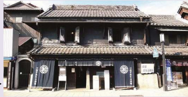
川越市蔵造り資料館▶

解体の程度や修理方法などの検討・事前調査を実施し、保存修理及び耐震化工事を行う。