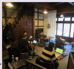
令和2年度のワーキングスペース実証実験の様子▶

歴史的建造物の所有者、民間事業者及び行政の緊密な連携のもと、未活用の歴史的建造物の健全な保全を図ったうえで流通の促進及び利活用を進め、さらに包括的な施設の管理・運営を行い、事業の経済活動の中から資金を確保する仕組みの構築を行う。