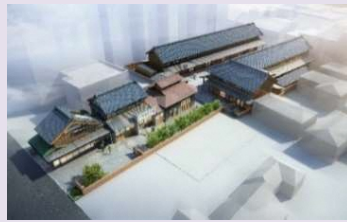
事業完成イメージ図▶

文化財としての復原を行うとともに、建物を生かすため、若手のクリエイターが創業支援を受けながら一定期間制作活動を行う文化創造インキュベーション施設として活用するための整備等を行う。