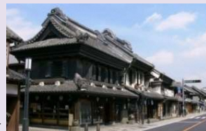
川越市川越伝統的建造物群保存地区▶

建築物等の修理や修景行為に関わる費用に対する補助及び保存活動事業に寄与する団体に対して補助する事によって、伝統的建造物群保存地区の歴史的風致の維持向上を図る。