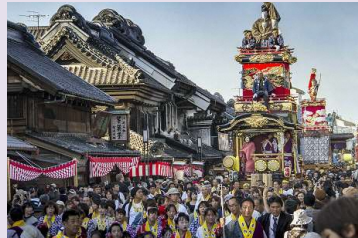
川越まつり (川越氷川祭の山車行事)

川越まつりは、城下町川越の総鎮守である川越氷川神社の例祭を起源とし、祭り神事に町方の祭礼行事を加えたもので、江戸「天下祭」の様式や風流を今に伝える貴重な都市型祭礼として、城下町の繁栄を担った川越の人々により370年の時を超えて守られ、川越独特の特色を加えながら発展した。歴史的な町並みを舞台に、豪華な山車が曳き回される伝統行事は、山車持ち町内だけでなく、周辺地域の市民や観光客にも親しまれている。