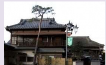
喜多院界隈の町並み

門前町は、表通りの余所行きの顔とは異なり、飴菓子や焼き団子、うなぎの匂いが漂う庶民的な場所であり、懐かしい佇まいが訪れる人々を引き付けてやまない。料理店として愛される妓楼建築や昭和初期の建物が残り、いくつもの時代を古刹と共に乗り越えてきた門前の賑わいが、歴史的風致として息づいている。