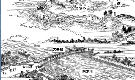
木曾路名所図会 大井驛

武並神社(重要文化財)や中山道沿いに町屋が位置する中山道大井宿では武並神社例大祭や七日市が町並みとともに地域住民によって大切に受け継がれている。