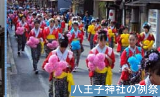
八王子神社の例祭