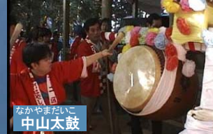
なかやまたいこ 中山太鼓

市内の農村集落では、太鼓や獅子舞等の様々な奉納行事や、地歌舞伎といった伝統芸能が受け継がれている。それは地域の人々の営みを凝縮したものであり、今もその伝統を受け継いで暮らしている。