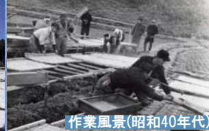
作業風景(昭和40年代)