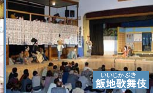
いいじかぶき 飯地歌舞伎