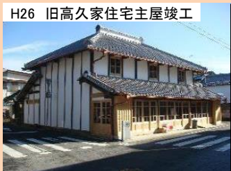
H26 旧高久家住宅主屋竣工

歴史的景観に配慮し、個人宅のブロック塀について板塀にする修景事業を行う。H21～H22