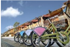
公共シェアサイクル「まちのり」

重点区域を回遊する手段としてのシェアサイクル「まちのり」の利便性を高め、市民及び観光客が歴史的な街並みを快適かつ効率的に周遊することにより歴史的風致の理解促進を図る。