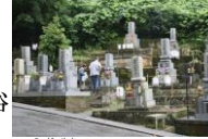
野田山墓地(お盆の風景)

卯辰山、小立野台地、寺町台地の3つの丘陵・台地で形成された起伏のある地形と寺町台地に連なる野田山など、丘陵地の豊かな自然があり、そこでは、特徴的な宗教行事や民俗行事が現在も息づいている。