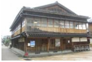
茶屋建築(ひがし検番)

藩政期以来のひがし、にし、主計の3茶屋街では、一般の町家建築とは趣の異なる茶屋建築が残っている。このような昔ながらの茶屋建築では、加賀百万石の伝統文化を示す芸能や茶屋文化が現在も華やかに息づいている。