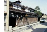
旧街道に見る町家(大樋町)

藩政期に城下の約3割の面積を占めていた町人居住地は、北国街道や往還の沿道に線的に広がっていた。旧往還の沿道などには、間口が狭く両隣が建て詰まり、奥行の深い町家建築が現在も残り、旧町人居住地の往時を偲ぼせる。