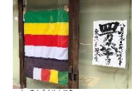
四方六十日参りの案内

藩政期に形成された卯辰山山麓、小立野、寺町の3寺院群では、藩政期から広く庶民の間で信仰されてきた宗教行事や民俗行事が盛んで、現在も季節ごとにそれらを寺院や神社で見ることができる。