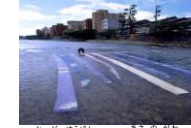
加賀友禅流し(浅野川)

犀川と浅野川は金沢を代表する河川であり、川幅が広く悠々と流れる犀川と、流れがやさしく繊細な情緒が漂う浅野川では、民俗行事や伝統工芸に関する作業を見ることができる。