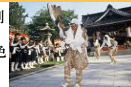
山王悪魔払い(大野町)

旧城下町の周辺には、藩政期に物流や特別の産業によって城下町と深く関わりながら発展していた地域があり、現在でも歴史的風致を色濃く残す地区(金石・大野地区等)がある。