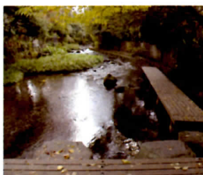
GW三島の水辺環境保全活動