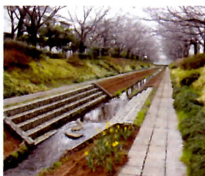
江川せせらぎ緑道・維持管理活動