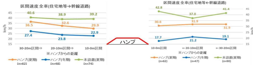
図7 ハンブ前後の自由走行速度(冬期もハンブを存置している地域)

このことから、冬期にはハンブの形状がはっきり現れなくても、堆雪によって速度が抑制されると考えられる。