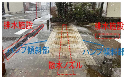
図1 除雪グレーダー及び消雪パイプを設置したハンプ