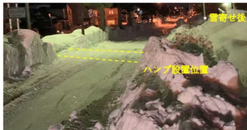
図6 ハンブ設置位置の除雪事例