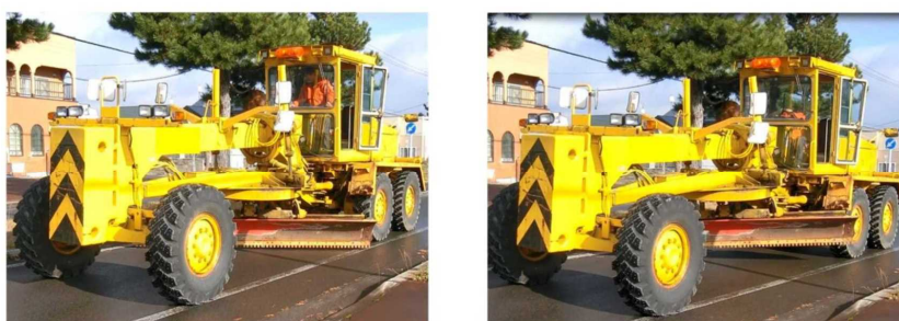
図3 除雪グレーダーのブレード(左:ブレードを下げた状態 右:ブレードを上げた状態)