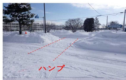
図5 ハンプ設置箇所(左:夏期 右:積雪時)