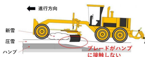
図4 除雪グレーダーでの除雪(イメージ)