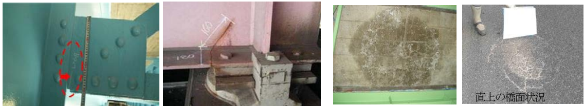
発生部材の役割や損傷位置により判定が大きく異なる