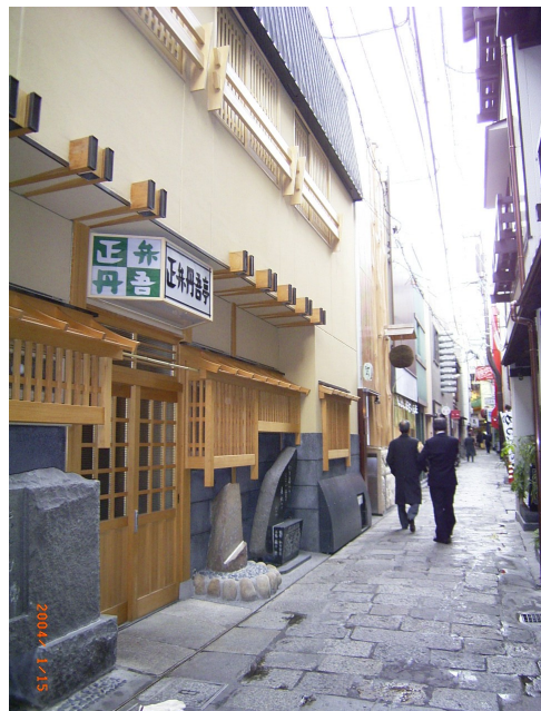
写真 5-2 現在の法善寺横丁の様子