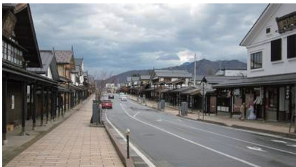
写真2：現道拡幅と沿道修景（南魚沼 牧之通り）