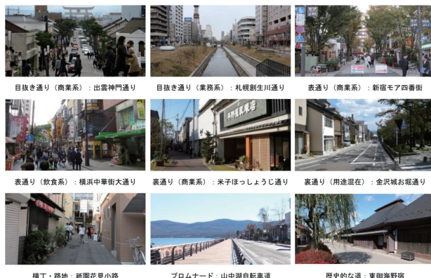
図-1：道路・場所の性格に基づく類型の例

類型化と並行して、各事例における整備を通じて得られた空間的な質の向上について、分析を行った。使い勝手、居心地の良さ、賑わい等、定量的な把握が難しい項目を評価するための基準として、感覚的快適性（交通機能・環境保全・防災・身体的快適性）、知的・精神的充足感（歴史的持続性・文化的持続性・新たな都市活動やサービスの充実）、礼的秩序感覚（住民等による維持管理の促進・民地外構のしつらえ）の3つの評価軸を提示し、各類型における質の向上を評価した。