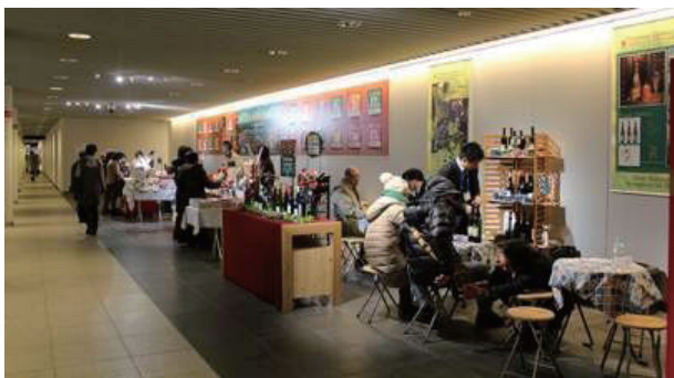
写真4：まちづくり会社による運営（札幌 駅前通地下）