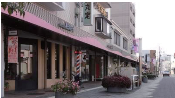
写真3：効果的な街路景観の統一（豊田 桜町本通り）