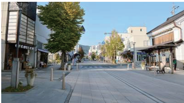
写真1：空間再配分と施設更新（長野 中央通り）

件の内、71件で住民との協働による検討体制が組まれていた。ただし、ハード整備の会議体が完成後の運営にまで継続的に関わっている事例は少なかった。整備後の道路の運営には、民間主体のまちづくり会社などによるエリアマネジメントを活用した事例も見受けられ、今後注目すべき動向と言える。