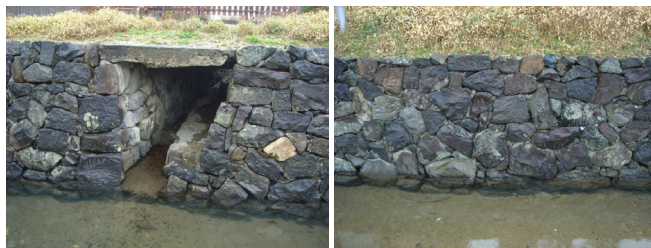
写真-2 整備後の護岸の石積みと目地の様子

工法については、石積み自体の歴史的な景観を損ねないように、原位置の石材をできるだけ使用した「空石積み風の練石積み工法」が採用された(図-1 類型3)。バイブレーターの使用を抑え、裏込めのコンクリートが極力表面に流れ出ないように工夫を行うとともに、将来的な孕み出しの防止が重視されている(写真-2)。一部不足する石材については、周辺の採石場から類似の石を調達し、基礎付近等の目立たない箇所に使用している。本工法を採用することで、空石積み風の練石積みのノウハウや整備の着眼点という技術的情報が蓄積されたことに加えて、当該護岸工事の下請けとなった地