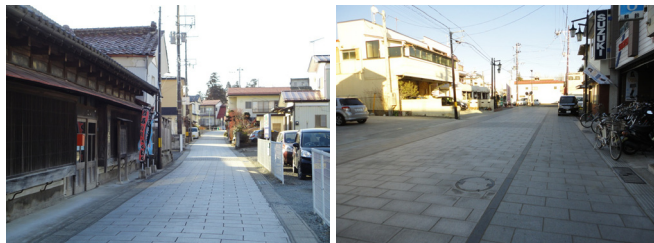
写真-5 舗装整備後の様子 (左：老舗通り、右：一番町大工町線)

耐えられる耐久性を重視している（図-1 類型4）。当工法により、当該路線が歴史的街路であるという認識が地域住民に一定程度広がるとともに、井戸端会議等の交通以外の生活空間としての利用が見られており、沿道の景観形成に対する意識を高める契機として機能するという効果が生じている。