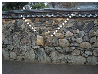
写真-3 全面改修実施区間 写真-4 部分改修実施区間 V字の白線内を改修