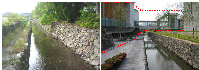
写真-1 藍場川の様子(左:整備前、右:整備後) 整備後の赤枠は美術館増築部分

山口県萩市城下町の中心部を流れる藍場川は、江戸中期の開削の際に整備されたと言われている。藍場川の石積み護岸のうち、下流部の平安古町内の両岸約140mの空石積みに孕み出しが見られたため、2009年から2010年にかけて補修が行われた。当該区域は、山口県立萩美術館・浦上記念館に隣接し、また萩市景観計画の重点景観計画区域でもあるため、歴史的な石積み護岸と周辺地域の景観を一体的に保全することが重視された。実際に、護岸改修と並行して行われた美術館の増築工事では関係者間の調整が行われ、美術館の間を流れる河川が一体的な景観を形成している(写真-1)。