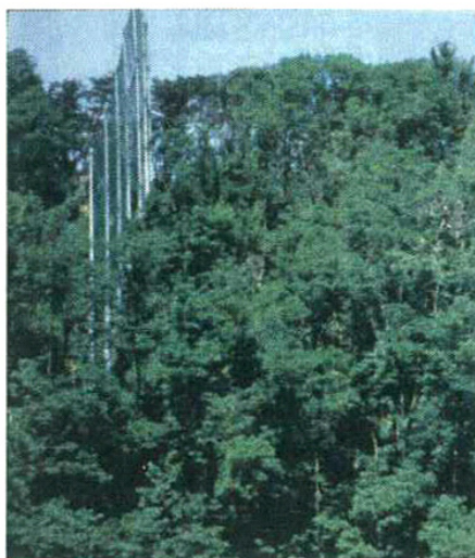
写真－動物参考－1 設置されたネット