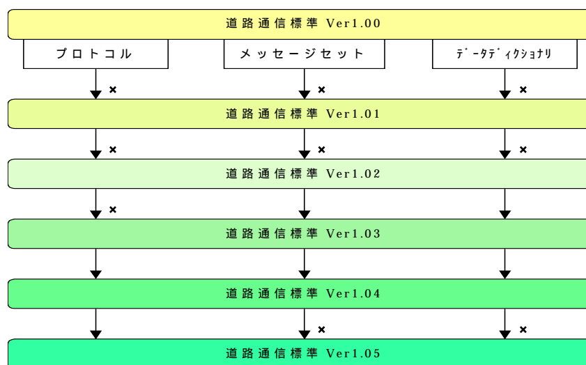
図 道路通信標準改訂における下位互換性の確保状況

道路通信標準のバージョン間の互換性の確保状況は下図の通りであるが、今後改定を行う場合には、下位互換の確保を確実にを行う必要がある。