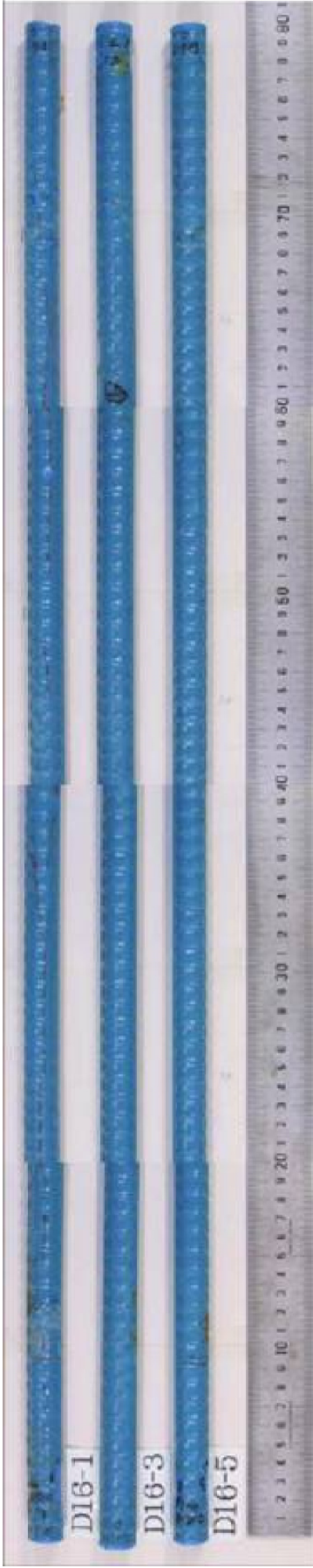
付図 2.5.19(a) D16-1,D16-3,D16-5 塩水噴霧試験前の状況(上(噴霧)面)