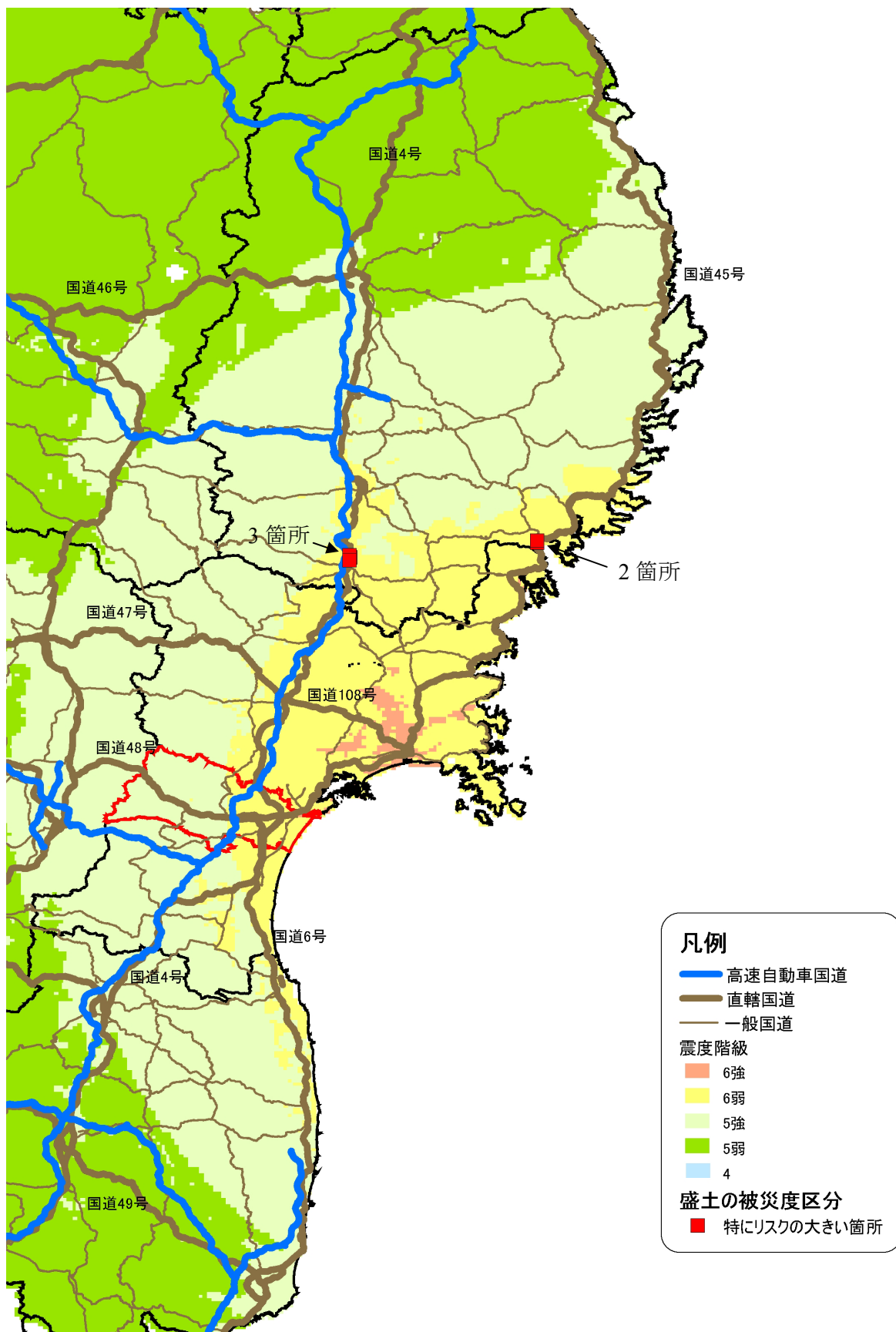
図4-9 盛土の沈下量推定結果(連動ケース)