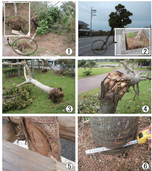
写真 1 台風による樹木被害と支柱や草刈機により損傷した樹木の例

の一つとして考えられた。さらに、草刈機の刃によって幹が損傷を受け、その後腐朽して倒木に至ったケースも確認された。