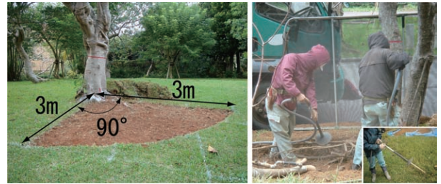
写真 2 根系調査範囲（左）とエアースコップを使用した掘削状況（右）